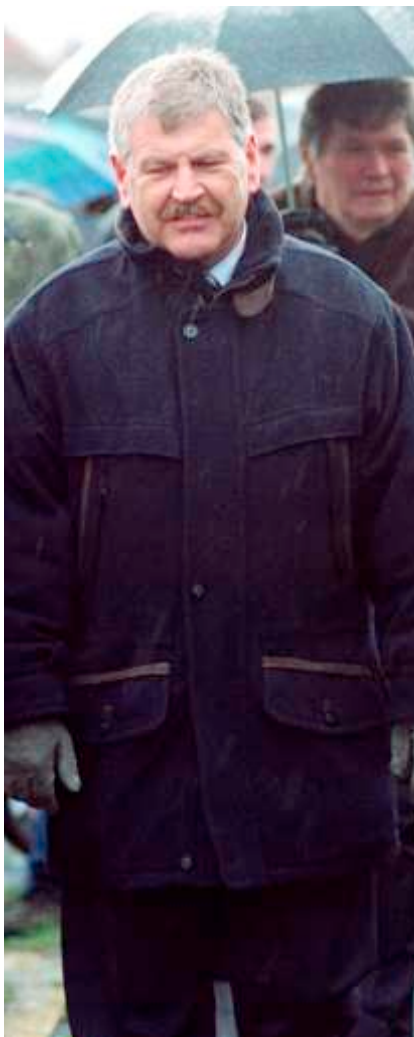
Udo Voigt, Bundesvorsitzender der Nationaldemokratischen Partei Deutschlands (NPD) bei einer Demonstration am 09. November 2002 in Weimar. Am Jahrestag des antisemitischen Pogroms von 1938 demonstrierte die NPD mit dem Ziel, "Deutschlands Selbstbestimmung endlich (zu) vollenden".

Seit März 1996 ist Udo Voigt Chef der NPD. Augenscheinlich imponierte ihm, was sich bei der Parteijugend tat. Von taktischen Distanzierungen abgesehen, tolerierte er bis in die Gegenwart die aktive Mitarbeit von militanten Neonazis nicht nur in der JN, sondern auch in allen anderen Parteigliederungen. Zugleich versuchte er, die Partei im legalistischen Fahrwasser zu halten, um potentielle bürgerliche Protestwähler nicht zu verschrecken. Eine Haltung, die sich zunächst insbesondere in den neuen Bundesländern durch starken Zuwachs an Mitgliedern auszahlte. Dieser Spagat wurde jedoch schließlich zur existenziellen Bedrohung für die NPD. Weil der zwischenzeitlich soweit erstarkte militant-aktionistische Flügel im Verlauf der im Frühjahr 2000 bereits zugespitzten Verbotsdebatte eine interne Kampagne zur Durchsetzung einer grundsätzlichen Radikalisierung der Partei entfesselte. 5