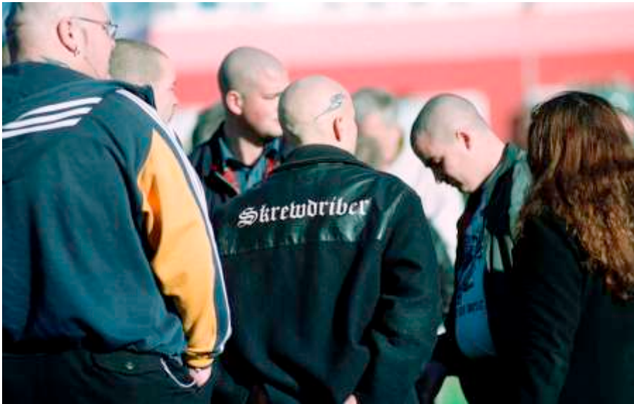
Bekennnis im Jackenaufdruck: die britische Band "Skrewdriver" hat Kultstatus unter rechten Skinheads. Im Bild zu sehen sind TeilnehmerInnen der Demonstration am 09. November 2002 in Weimar.

kannte Gothaer Band. Hakenkreuze auf dem Cover, sowie volksverhetzende und gewaltverherrlichende Liedinhalte, lösten ein Ermittlungsverfahren aus, das letztendlich zu einer großangelegten Polizeiaktion im August 2001 führte. Zwölf Durchsuchungen in Wohnungen und einem Tonstudio in Gotha-Ost förderten nicht nur eine scharfe Schusswaffe, umfangreiche Bestände an rechten Propagandamaterialien und sonstige Ausrüstungsgegenstände zu Tage, sondern auch Diebesgut im Wert von fast 250.000 Mark. Wie sich herausstellte, war das Equipment für die Musikproduktion im Tonstudio ebenfalls zusammengestohlen. 114 Ein Gutteil der sicher gestellten Gerätschaften und Instrumente gehörten der lokalen Band "New Paints". Unmittelbar nach der zweiten Durchsuchungsaktion sollen Thomas W. und Pierre St., damals 26 und 25 Jahre alt, in Untersuchungshaft genommen worden