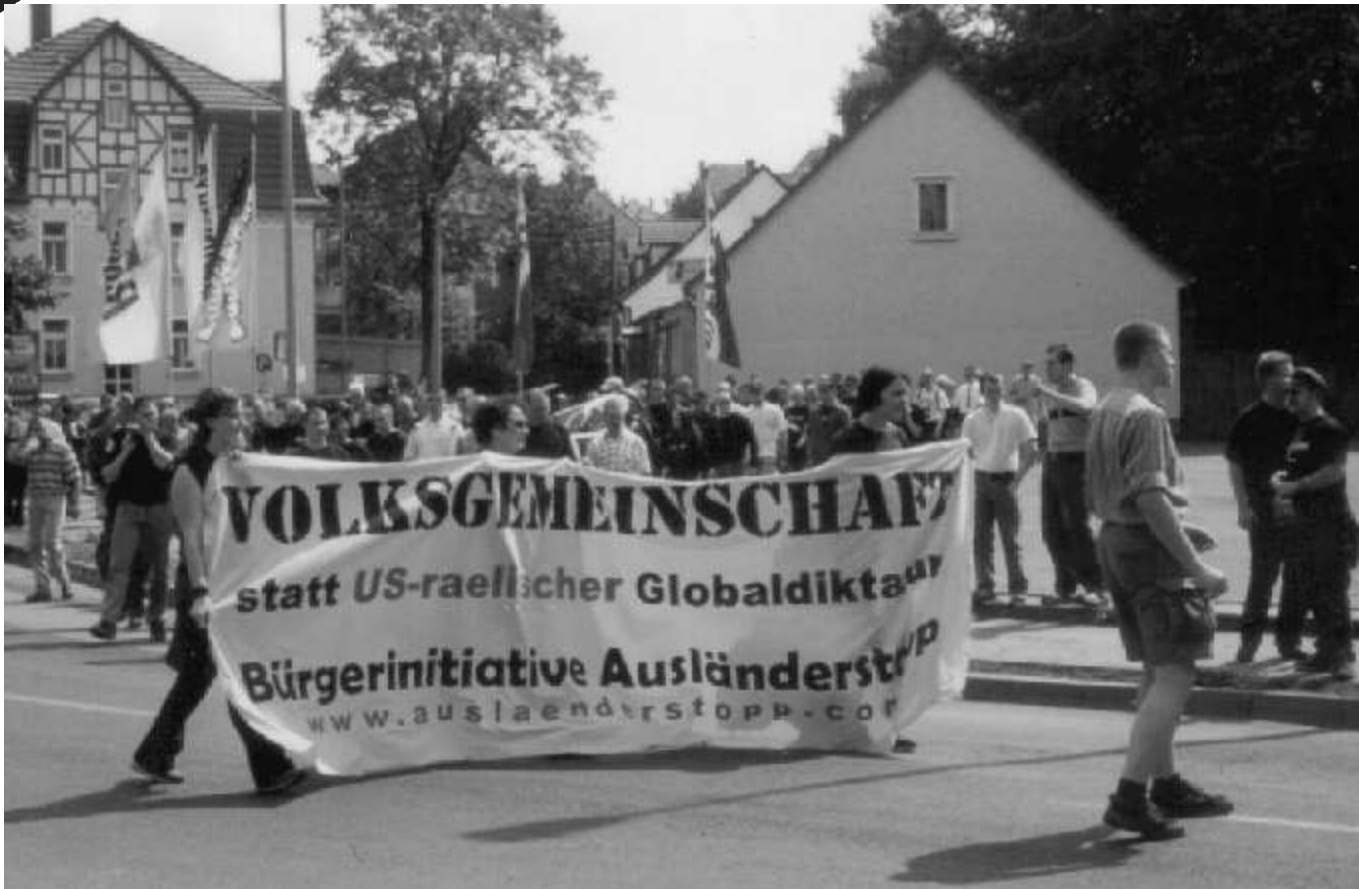
In wenigen Worten das ganze Programm des Antisemitismus: Flüchtlinge als Agenten der amerikanisch-jüdischen Weltverschwörung gegen das deutsche Volk, Personalisierung gesellschaftlicher Zusammenhänge (USA & Israel gegen "uns"), Denken in manichäischen (unauflösbaren) Gegensätzen. Im Bild zu sehen sind Neonazis beim Aufmarsch am 20. Juli 2002 in Gotha.